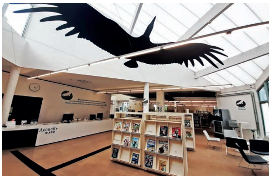
La Médiathèque Paul Géraldini vous attend avec un alléchant programme d’animations.