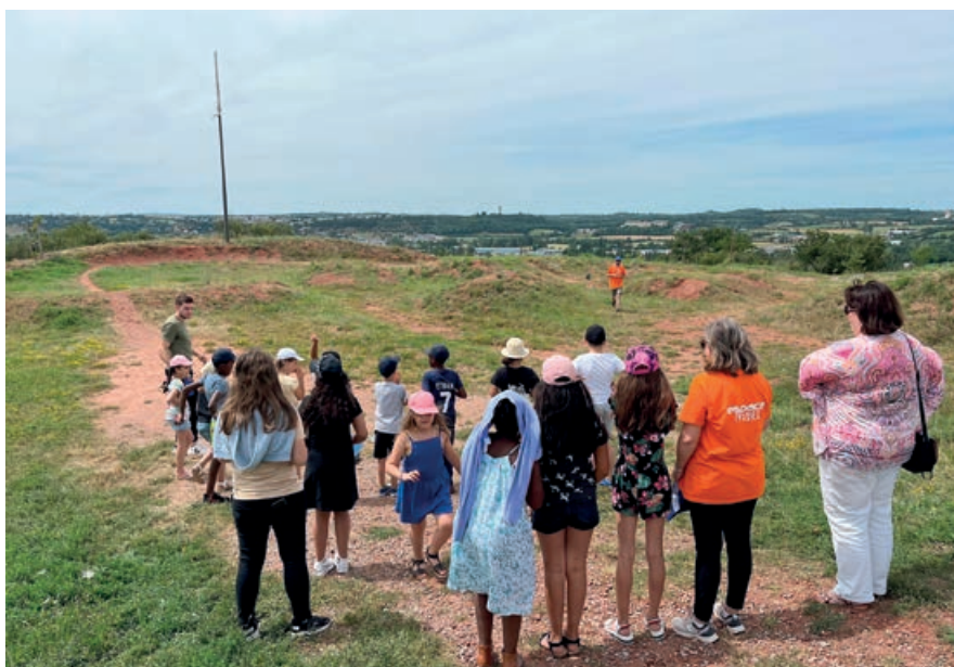
"Espace dans ma Ville", lancement de fusées depuis la colline de St Mayme.

Parallèlement, les loisirs en famille ont, eux aussi, connu un vif succès, avec plus de 140 participants enregistrés lors des sorties au Jardin des bêtes, au lac de Pareloup, et en bords de mer.