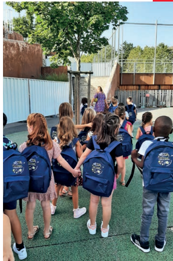
Remise des cartables aux élèves de CP à l'école Jean Laroche

La commune d'Onet-le-Château accueillait 3 427 apprenants (élèves, collégiens, lycéens, étudiants, apprentis...) en septembre 2023, soit 3% de plus qu'à la rentrée 2022.