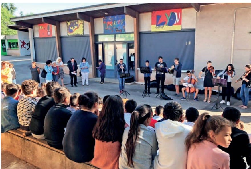
La culture par l'éveil musical, un enjeu primordial pour la jeunesse.

Les instruments, acquis, entretenus et changés par la collectivité, sont mis à disposition des élèves des écoles primaires. Le financement de l'enseignement musical au collège est également assumé par la municipalité.