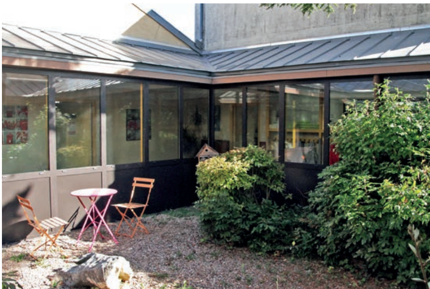
Les patios de l'école Pierre Puel ont été rénovés, pour un meilleur confort énergétique.

La Ville d'Onet-le-Château a également créé, depuis 2020, un poste de "référént parcours" dont les missions sont confiées à Laure Vignon.