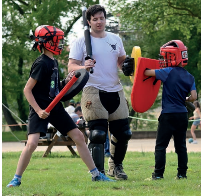
Une reproduction moderne de combats sportifs médiévaux