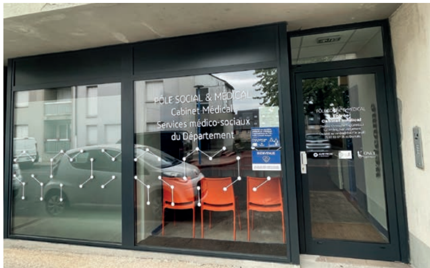
1 médecin généraliste, 2 médecins psychiatres et les services du Département se sont installés dans ces nouveaux locaux aux Costes-Rouges

Ce bâtiment sera situé "boulevard des Capucines" près de la M.J.C. Cette résidence va accueillir des Seniors dans des logements individuels neufs, sécurisés et au loyer accessible. Elle est située en cœur de ville, tout près de maints équipements sociaux, culturels ou de santé et à proximité immédiate d'un vaste parc urbain, de nombreux commerces et autres services.