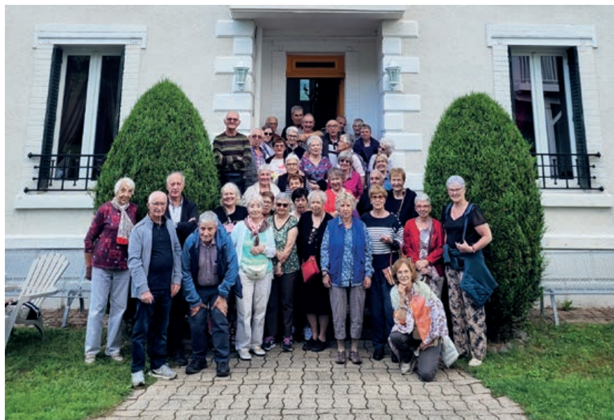
40 Seniors Castonétois se sont rendus dans le Cantal en juillet grâce au CCAS de la Ville d'Onet-le-Château.