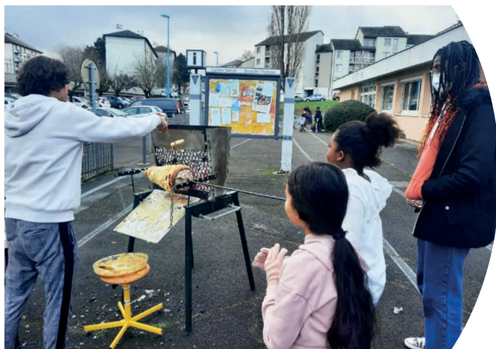
Ateliers gourmands, venez confectionner un gâteau à la broche le mardi 02 janvier prochain.

Enfin, pour fêter la nouvelle année, le Patio vous convie à un bal costumé baptisé “Onet Masqué”. Le principe est simple : votre plus beau masque sera votre allié dans l'après-midi du mercredi 03 janvier 2024. Atelier maquillage, musique et goûter géant sont au programme.