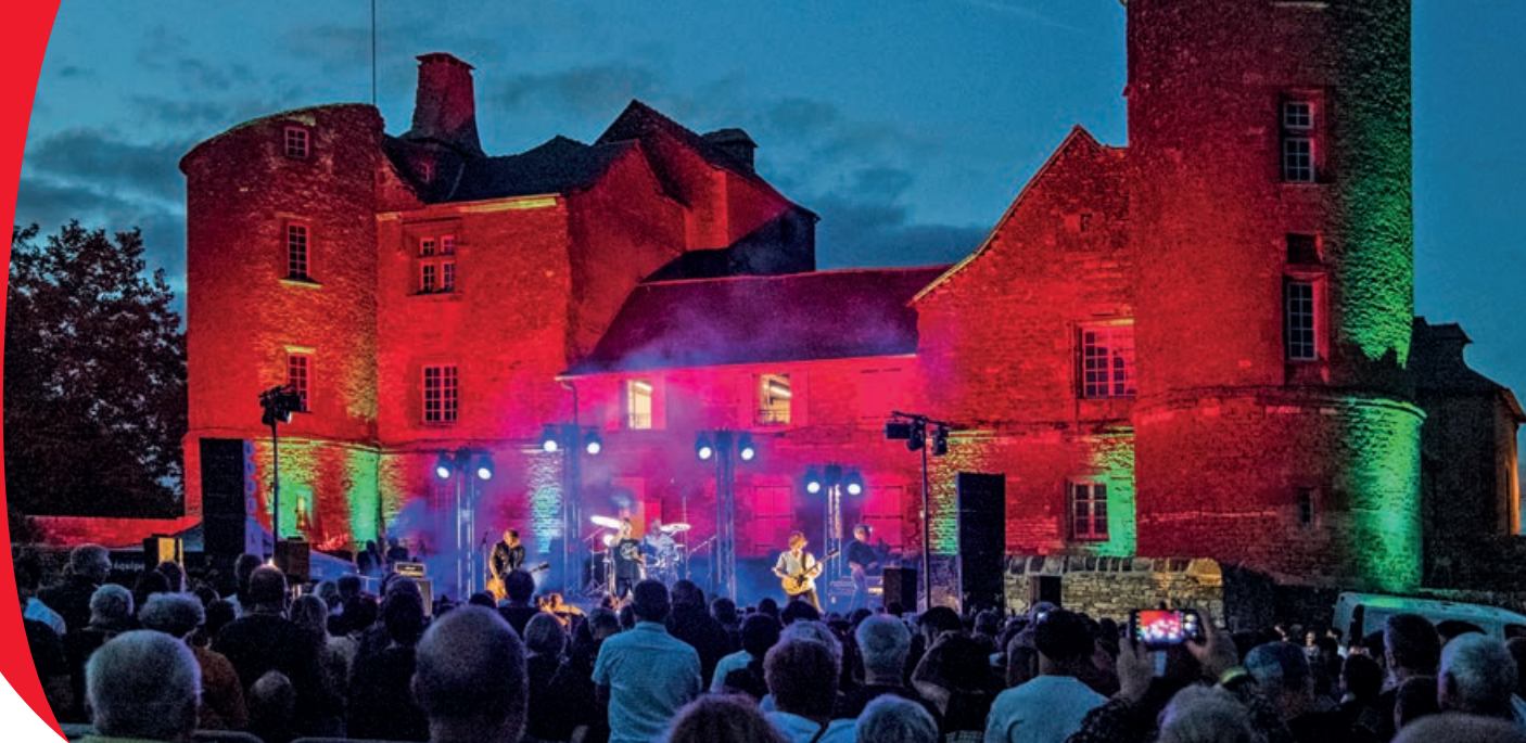
Le concert de Chef And The Gang a lancé la saison le 25 août, devant plus de 800 spectateurs au Château d'Onet-Village.