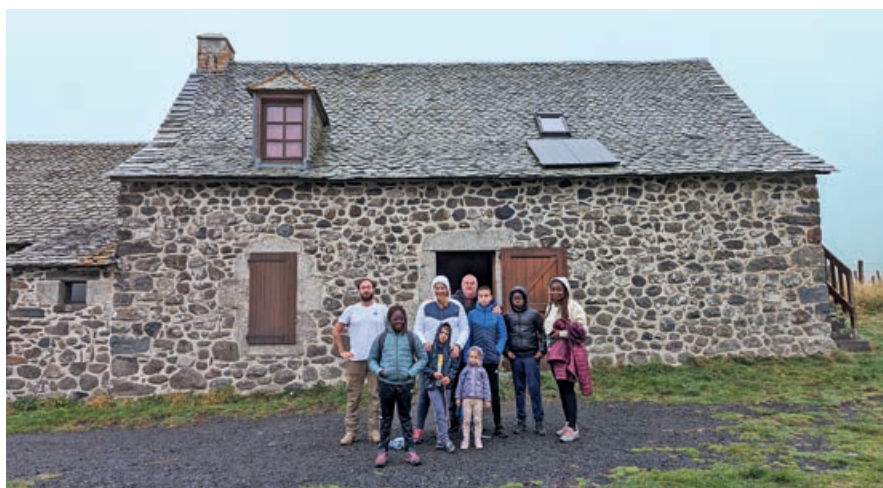
Une sortie en famille sur l'Aubrac pour écouter le brame du cerf.