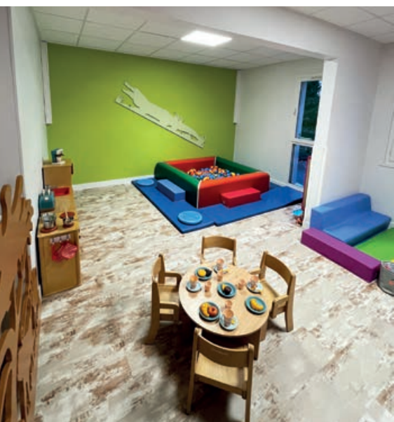
Le Coulicou, un local fait-maison par les services techniques de la Ville

La commune d'Onet-le-Château est dotée de 2 RPE (l'un au Costes-Rouges, l'autre aux Quatre-Saisons) qui sont au service de la quarantaine d'Assistants Maternelles présentes sur la commune. Dans ces structures, sont organisés des temps collectifs, des temps d'ateliers ou d'intervention de professionnels extérieurs (psychomotricité, yoga pour enfants...) ainsi qu'un accompagnement administratif individuel.