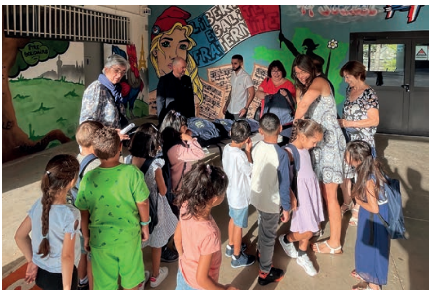
Remise des cartables aux élèves de CP à l'école Pierre Puel

Cette volonté se traduit également dans le gel des tarifs de la restauration scolaire et ce, malgré les hausses significatives du coût des denrées et des matières premières.