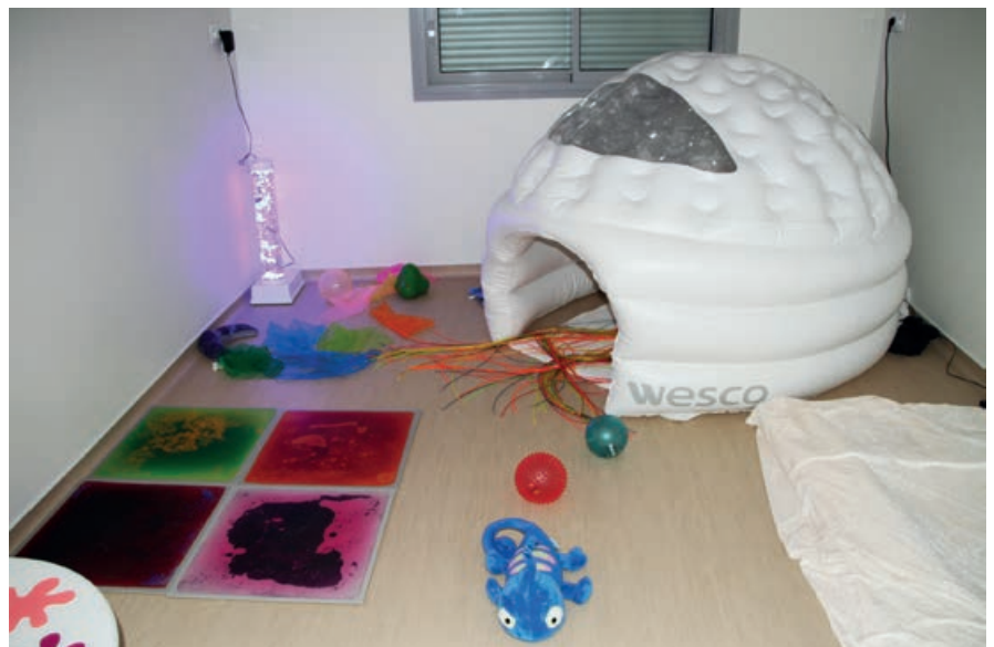
Espace Snoézelen des Lupins

L'accompagnement de vos enfants est réalisé au sein d'équipements neufs ou complètement rénovés par la Ville, afin d'accueillir les familles et les professionnels dans les meilleures conditions.