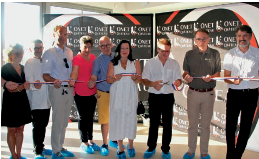
Inauguration de la crèche le 22 août dernier en présence des partenaires du projet.

L’évolution des normes, mais également des besoins des enfants et des professionnels, ont été pris en compte dans la construction de ces nouveaux locaux. Ainsi, la crèche est structurée en trois sections. Chacune bénéficie d’un espace de préparation des repas, d’une biberonnerie, de dortoirs, de salles d’activités modulables et d’une cour extérieure végétalisée.