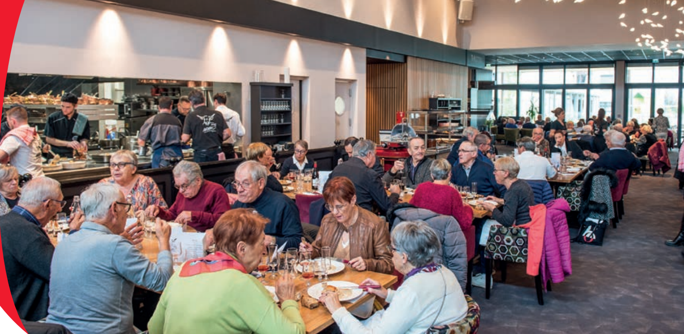
Un moment de partage et de convivialité pour plus de 1 000 seniors lors des Repas des Aînés.