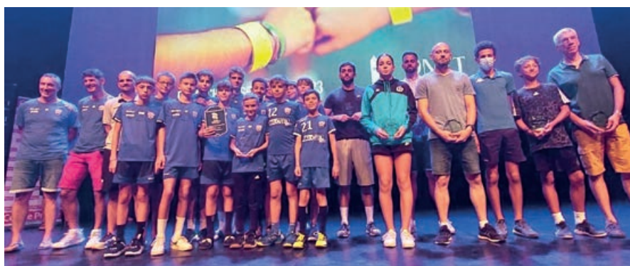
Les bénévoles Castonétois récompensés par la Ville pour leur engagement quotidien

Qui a dit que le sport n'était pas un spectacle ? Lorsque la culture et le sport se croisent, c'est tout un public qui s'enrichit de nouvelles idées afin de faire battre le cœur de notre ville.