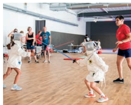
Escrimeuses en herbe lors de la journée dédiée au sport.

Ce coup d'essai brillamment réussi a convaincu tant les organisateurs que les participants à se donner rendez-vous pour la rentrée 2024, afin que cet événement devienne un moment incontournable de notre vie locale.