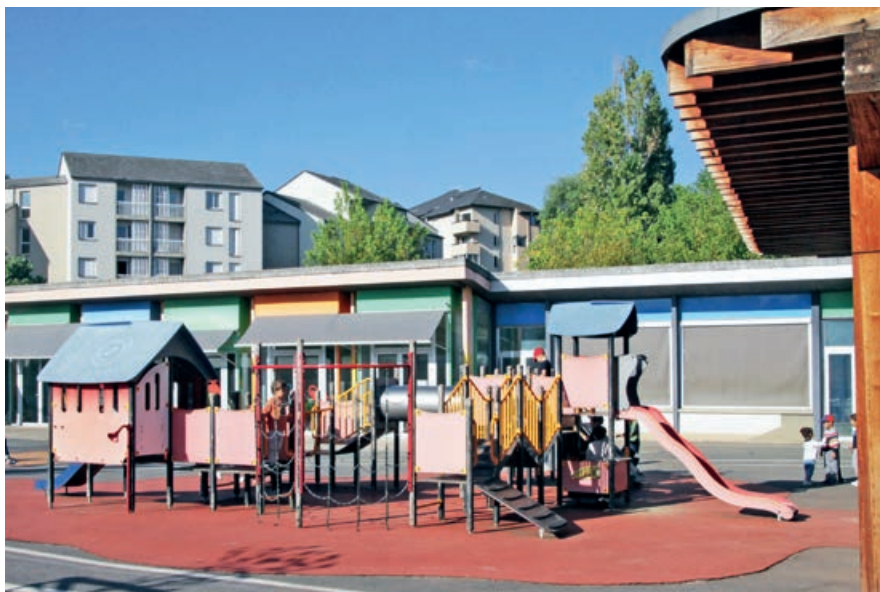
L'école des Narcisses a bénéficié d'une sécurisation et d'une rénovation énergétique.

Débutée avec la construction du nouveau Multi-Accueil Les Lupins, cette évolution se poursuivra en 2024 avec, notamment, le déménagement du RPE des Quatre-Saisons, actuellement implanté au Patio Centre Social, dans les locaux de l'ancienne crèche qui seront complètement remaniés.