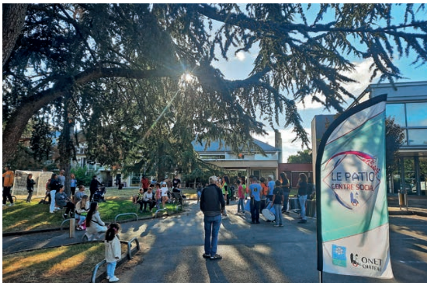
Animations en famille durant les vacances.

De 65 à 120 enfants accueillis en moyenne pendant les vacances scolaires