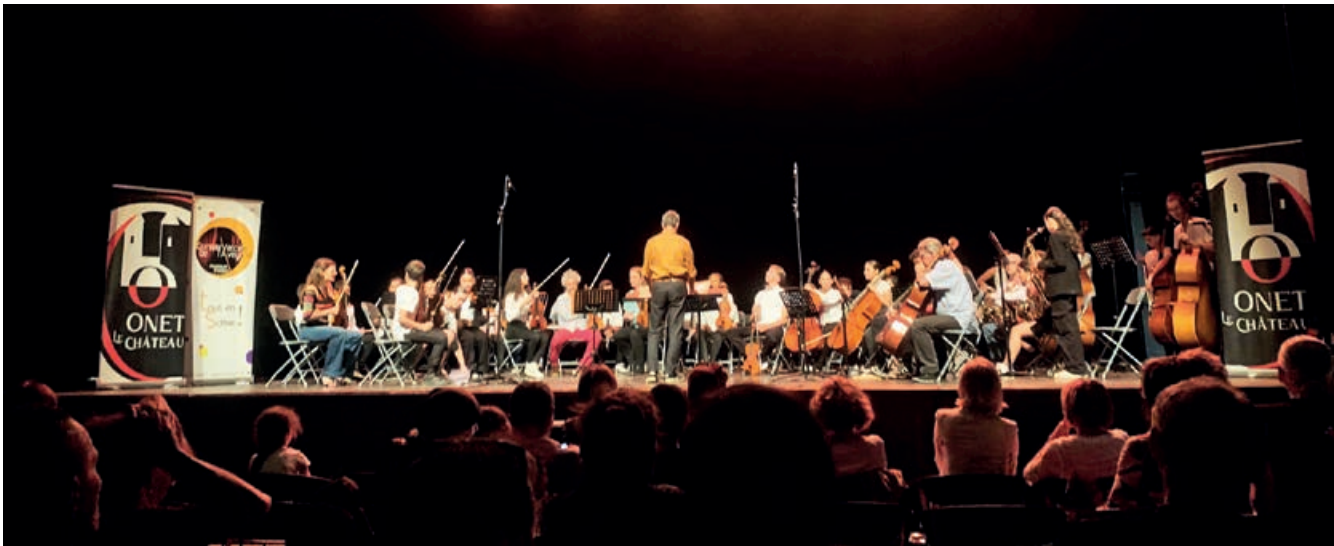
Plus de 100 élèves sur la scène de l'Athyrium tout au long de la soirée du concert "Orchestre à l'école"