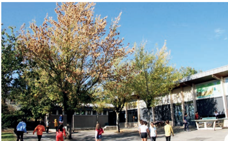
L'école des Genêts bénéficie quant à elle d'un nouveau toit.

Afin d'encadrer au mieux les petits écoliers de la commune, la Ville d'Onet-le-Château a fait le choix de positionner une ATSEM à temps plein sur chacune des classes de maternelle. Ces 11 assistantes maternelle accompagnent le personnel enseignant pour répondre aux besoins des quelque 230 enfants concernés.