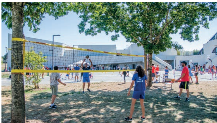
Un public venu en nombre à la rencontre du tissu associatif, installé au cœur des Quatre-Saisons le temps d'un week end.

Pour la première fois dans l'histoire d'Onet-le-Château, une rentrée associative commune sur trois jours a été organisée afin de créer une synergie entre tous les acteurs de la vie locale Castonétoise. Baptisé “Anim&vous”, ce nouveau rendez-vous avait pour objectif la découverte, l'échange, le “aller vers” et le vivre ensemble.