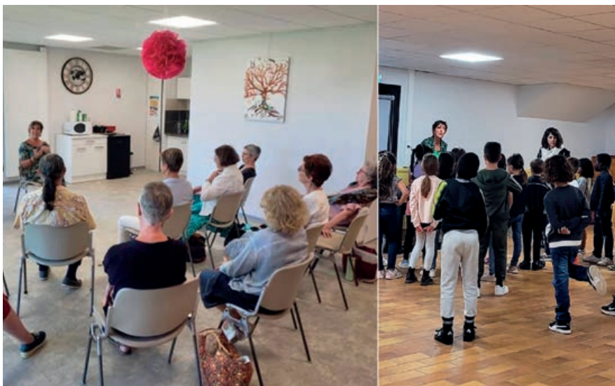
La chorale Intergénérationnelle

Au-delà de l'accompagnement social, diverses actions sont initiées : "ateliers cuisine", en partenariat avec le Patio Centre Social, "atelier coiffure et esthétique" à l'Épicerie Sociale, sensibilisation sur les risques liés à la consommation d'alcool avec l'ANPAA, "ateliers nutrition santé", journées "mars bleu" et "octobre rose".