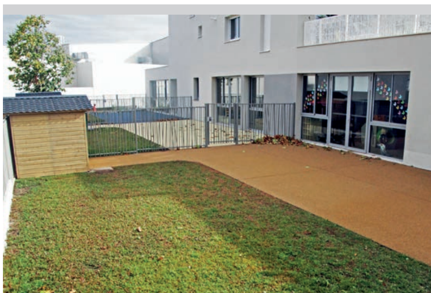
Chaque section des “Lupins” bénéficie d’une cour extérieure végétalisée.