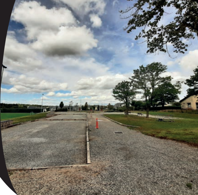
Le nouveau boulodrome des Costes-Rouges