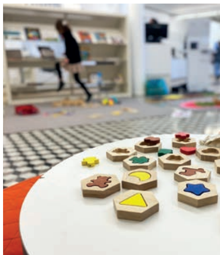
La ludothèque s'installe à la Médiathèque pour un après-midi "A vous de jouer"

La programmation culturelle dédiée au jeune public est proposée sur les temps scolaires et extrascolaires pour leur permettre de développer leurs connaissances et d'effectuer des rencontres artistiques.