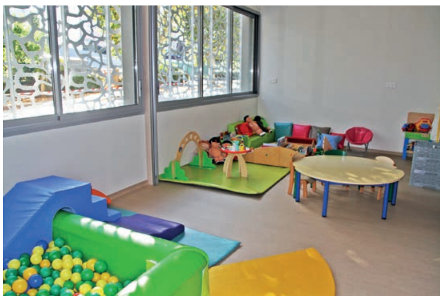
Des espaces pensés pour le confort des enfants.