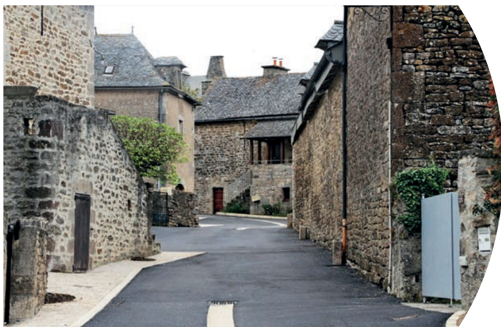
Le cœur du village retrouve une seconde jeunesse

La finalisation de l'opération se fera par la pose de luminaires adaptés à l'environnement et par un réaménagement qualitatif de la place du château. Et ce, dans l'attente du positionnement de la D.R.A.C. (Direction Régionale des Affaires Culturelles) sur les projets de rénovation proposés par notre municipalité pour ce bâtiment emblématique de notre commune.