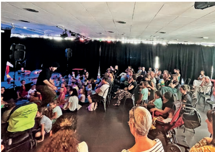
Chaque 2 ème mercredi du mois, retrouvez les “Rendez-vous Conte” au Café Culturel Le Krill

L'objectif est de faciliter susciter l'intérêt des enfants pour les livres. Pour y répondre, la Médiathèque propose des spectacles destinés aux bambins de “9 mois à 3 ans”, à raison de 4 représentations par semestre. Elle souhaite également favoriser la rencontre entre les auteurs, et les enfants. La Médiathèque est un lieu intergénérationnel, où petits et grands peuvent assister à des ateliers créatifs (dès 6 ans) ou encore s'amuser autour d'un jeu, en partenariat avec la Ludothèque.