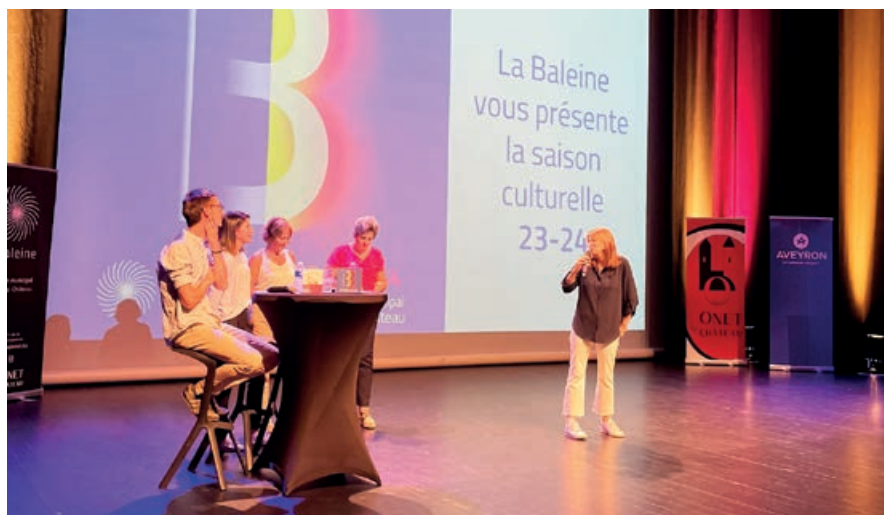
C'est parti pour la saison culturelle 2023/2024 d'Onet-le-Château.

● "The Tree", le 19 décembre à 20 h 30 : Dernière grande création de la prestigieuse chorégraphe Carolyn Carlson , "The Tree" est une réflexion poétique sur l'humanité et la nature, au bord du naufrage, avec l'espoir d'une renaissance à la manière du Phénix qui se régénère de ses cendres.