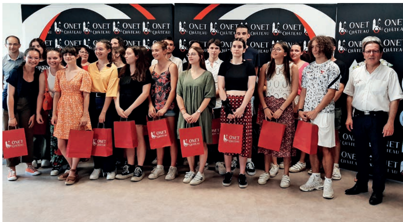
Les bacheliers 2023, en avant vers de nouveaux horizons studieux.